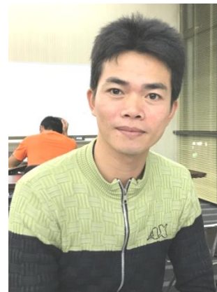
フン・ヴァン・ビン (ベトナム)