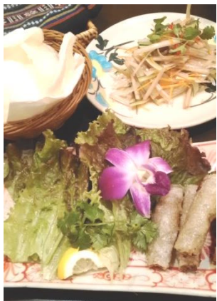
↑ 蓮の茎のサラダと チョコゾー(ミニ揚げ春巻き)