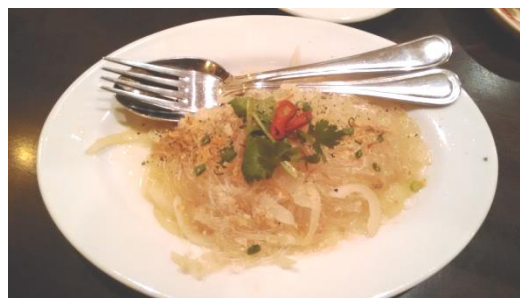
ベトナム産渡り蟹の春雨炒め