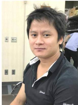
ゲン・ズイトアン (ベトナム)