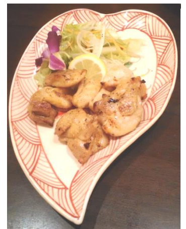
ホーチミンの屋台風焼きとり↑ シメにはベトナムコーヒーや蓮茶をどうぞ

料理だけなら、もうベトナムまで行かなくても アンデップで十分かも。 バッチャン焼の器がカワイイ