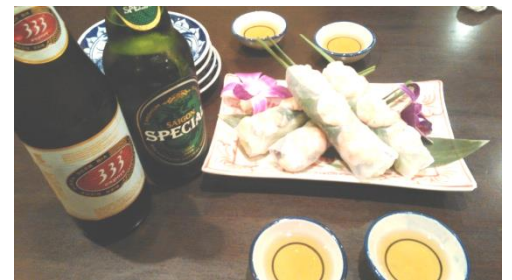
ビールは、333とハノイ・スペシャル

ベトナムのお金はインフレで今なら1万ドンがたったの50円！だから値段も「10万ドンとか100万ドンとか、なんか丸が多くて数えるのが大変！」みたいなことになってます。だから外国人は気をつけないと食後の清算になったらケタが1つ増えてたりするんです。もともと値段が高いガイドブックに載っているようなベトナム料理の店