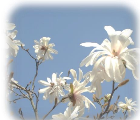
これはオリーブ、じゃなくて、満開だったシデコブシの花