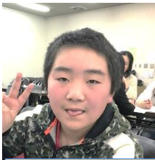
ス カイセン (中国)