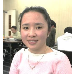
ビ ティ エム フォック (ベトナム)