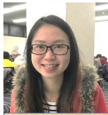
オン ヴインシン (マレーシア)