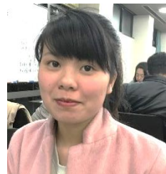
ビ ティ フォン (ベトナム)