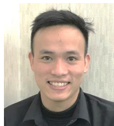
レイティエン コア (ベトナム)