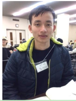
ゴー・スアン・ビン(ベトナム)