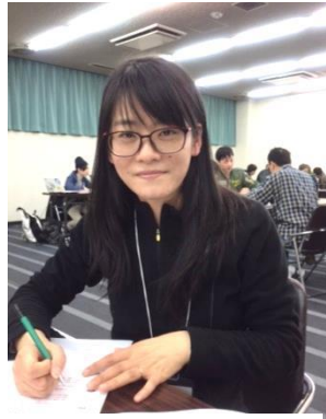
シー・チュン(中国)