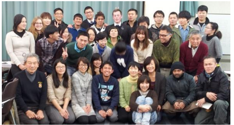
2014 年 最後のクラス終了後