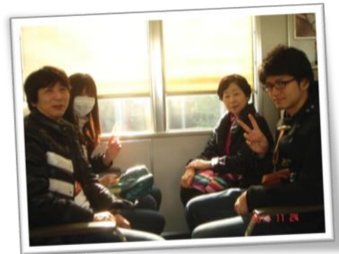
草津、南草津、京都、大阪～

オリーブ恒例、秋の遠足に行ってお参りました。ここのところ土日は雨の日が多く、少々心配していましたが、日頃行いの良い方ばかりだったおかげで絶好の行楽日和となりました。17名（うち生徒3名と家族2名）と少しさびしい参加人数ではありましたが、電車移動には迷子も出ずよかったですか？紅葉まっさかりの大阪城公園を抜けずは大阪城へ。階段で5階まで息を切らして昇った天守閣展望台からの眺めは、秋色の豪華な絨毯を観るようで本当に美しく心が洗われました。