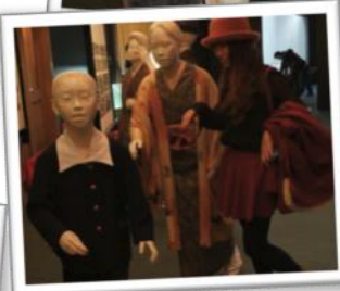
展示の一部 に？！お見事☆