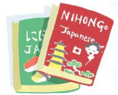
カタラノ エドアルド (ブラジル)