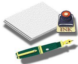
カタラノ ヤスミン (ブラジル)