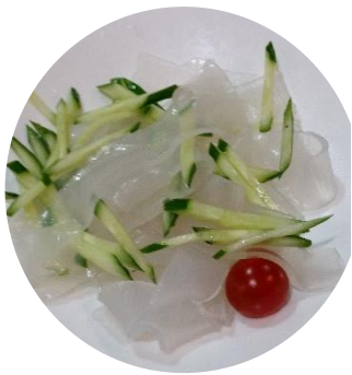
シンプルで涼しげな見た目