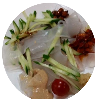
いろんなタレを順番にかけて味見、次は混ぜ合わせてみて、いろんな味を楽しめます。