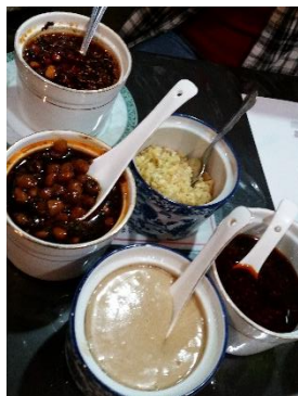
ピーナッツ、ゴマ、ショウガなど身体によい材料で作られた数種類のタレ