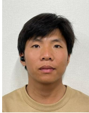
グエン・バン・タイン (ベトナム)