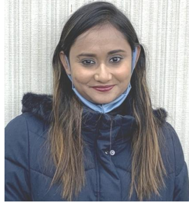
ディプティ・ダッタートレイ・ベヘラ (インド)