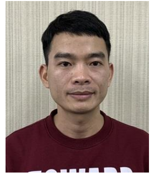
ファム・ヴァン・ビン (ベトナム)