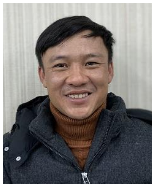
フック・バン・ハオ (ベトナム)