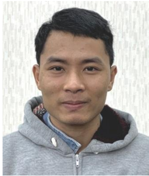
グエン・ウアン・ドゥック (ベトナム)