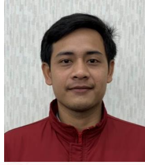
アント・ロマンダン (インドネシア)