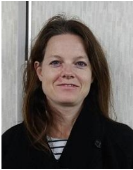
クリスティーナ・ ウェイルホーファー(米)