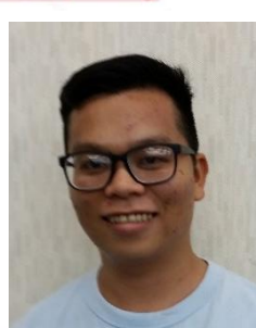
ファン・ミン・トウアン (ベトナム)