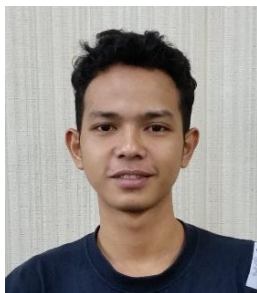
ビルダウス・オギ・アンド レアト(インドネシア)