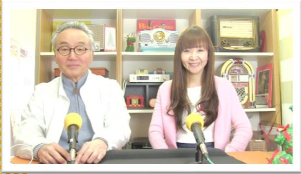
▲ええラジオの番組

Native(ネイティブ)という言葉は英和辞書で引くと ①生まれたときからの ②生まれ故郷の ③ ~生まれのひと ④もとからあるもの といった訳が書いてあります。「ネイティブアメリカン」や「ネイティブスピーカー」などの言葉でも馴染みのある「ネイティブ」という言葉、最近では人と時代のかかわりを表現する言葉として「スマホネイティブ」という言葉をよく耳にします。これはもちろんスマホを使いこなせる人のことではなく、オギャーと生まれた時にはもうそれがあたりまえに使用されていた世代という意味で使われている言葉ですね。その世代の前と後では「世の中が一変します。これからは「A・I ネイティブ」や「電気自動車ネイティブ」が生まれて来ます。