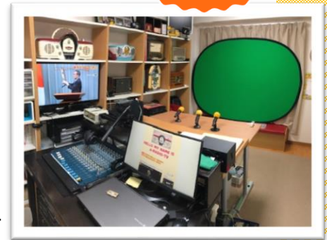
▶ええラジオ TV のスタジオ